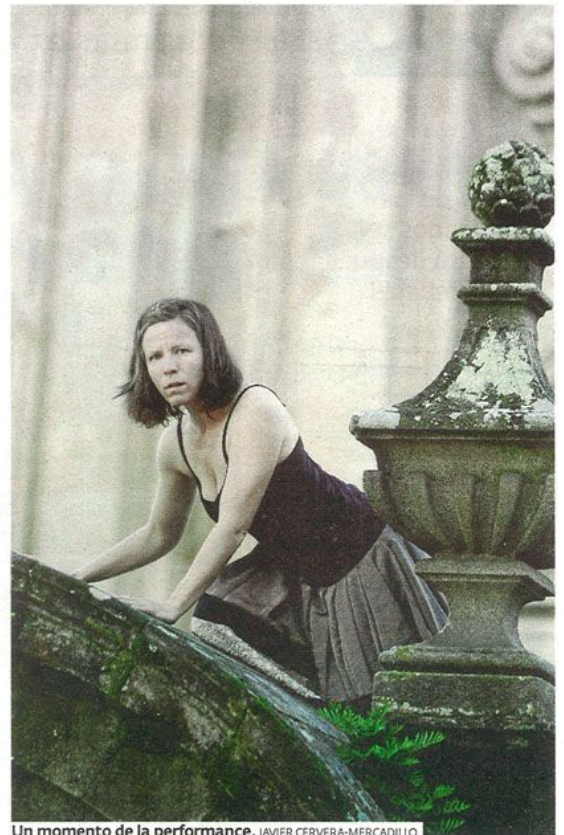
Un momento de la performance. JAVIER CERVERA-MERCADILLO

La acción artística de Bertels forma parte del proyecto 'Agasállame coa túa vida', a través del que realiza retratos de mujeres con las que comparte partes de su día a día y en el que busca respuestas.